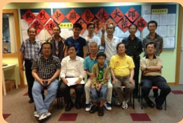
1月8日晚提高班结业